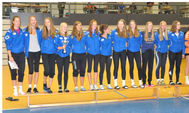
Der niedersächsische U16 weiblich Kader

Der nächste Landesvergleich der U17 männlich und U16 weiblich findet in Aligse vom 9. bis zum 11. Oktober 2015 beim Regionalen Bundespokal Nord statt.