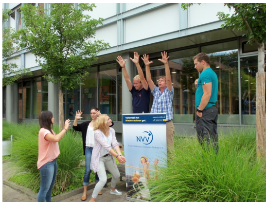
Projektgruppe „Social Media“